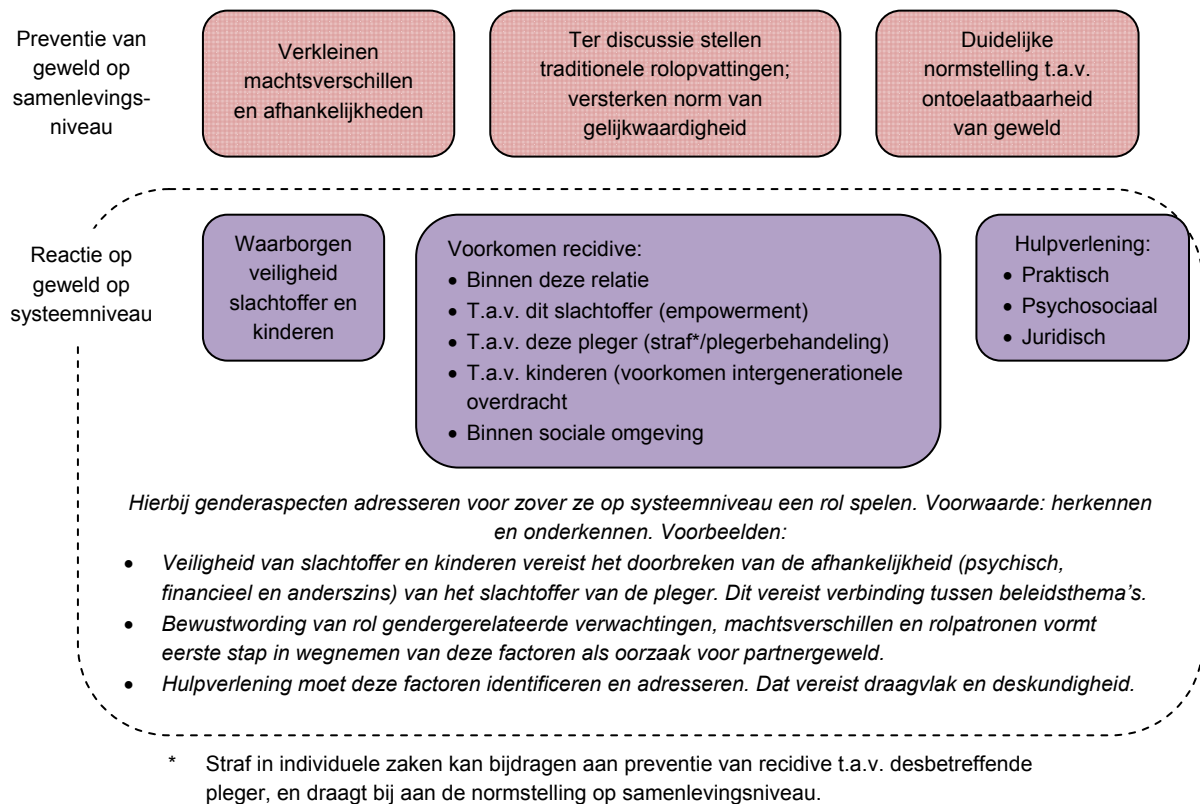
Figuur 7.2 De bijbehorende gendersensitieve aanpak

Een gendersensitieve aanpak begint met het onderkennen van de relevantie van gendergerelateerde factoren. Dat is meer dan het herkennen van sekseverschillen; bij gender draait het om de positie, rolpatronen en verwachtingen die worden gekoppeld aan sekse. Het onderkennen van de relevantie van gendergerelateerde factoren impliceert dus dat er een verband wordt gelegd tussen de sekseverschillen die worden waargenomen en de daaraan ten grondslag liggende maatschappelijke opvattingen, verwachtingen en posities. Een gendersensitieve aanpak is zich bewust van gendergerelateerde stereotypen en vooronderstellingen die leven in de samenleving, bij betrokkenen en hun sociale omgeving, bij zichzelf en bij andere uitvoerenden; stereotypen en vooronderstellingen over mannen, over vrouwen, over vaders en moeders, over homoseksuelen, over man-vrouwverhoudingen in andere culturen; stereotypen die het traditionele beeld van mannen en vrouwen bevestigen; of die dat beeld juist als achterhaald en niet langer relevant beschouwen.