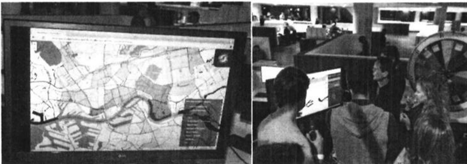
Impressie New Horizons Festival Rotterdam