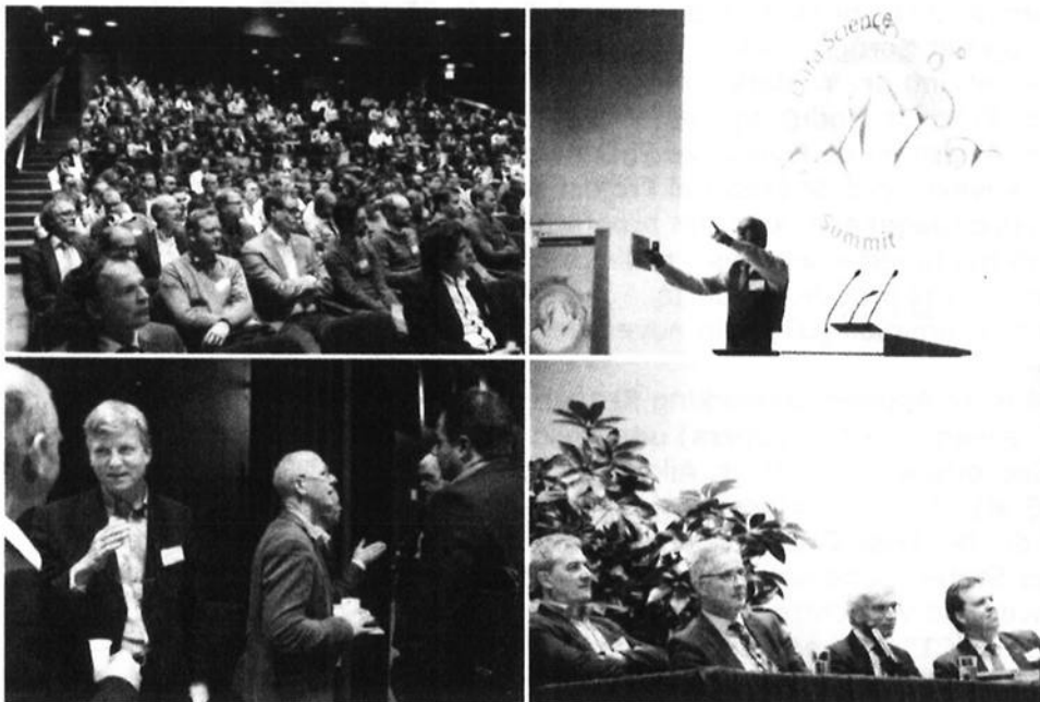
Impressie van Dutch Data Science Summit 2014