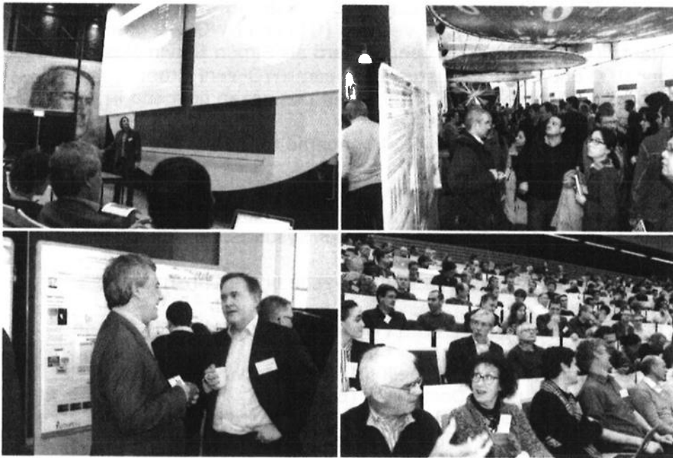
Impressie Delft Data Science event januari 2014

themabijeenkomsten voor onderwijs, onderzoek en bedrijfsleven over de verschillende aspecten, en de toekomst van, ICT en Data Science ontwikkelingen.