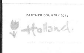
Impressie Holland High Tech op de Hannover Messe 2014